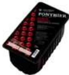
GUINDES FCP007 1 kg