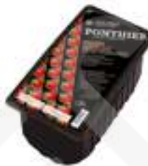
MADUIXA FCP006 1 kg