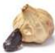
ALL SEC NEGRE NACIONAL