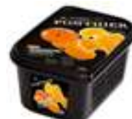
PURÉ DE MANDARINA 100% PFP016 / PFP056 1 kg / 20 kg