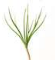
MICROBROTS DE PI MEDITERRANI CG061 50 g