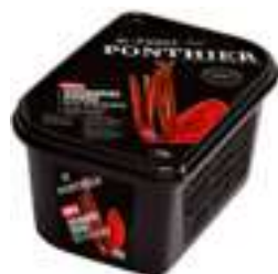
RIUBARBRE VERMELL FCP018 1 kg