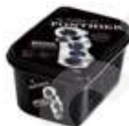
PURÉ DE NABIUS NEGRES