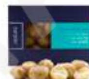
PATATES AMB OLI FUMAT