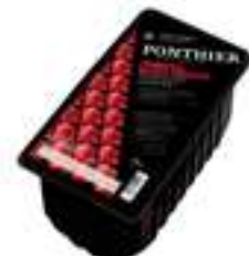
BRISURA DE GERDS