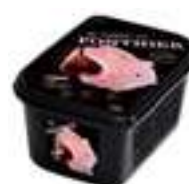
PURÉ DE FIGA PFP030 1 kg