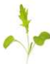
MICROBROTS DE MIZUNA CG008 100 g