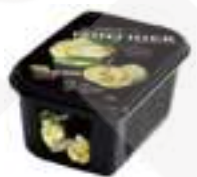
PURÉ DE LLIMONA 100% PFP079 1 kg