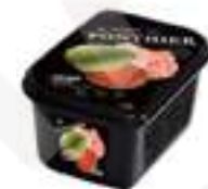
PURÉ DE GUAIBABA PFP012 1 kg