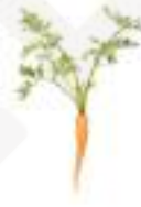
PASTANAGA BABY CGV10 25-30 unitats