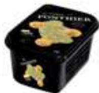
PURÉ DE YUZU 100%