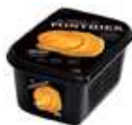
PURÉ DE TARONJA DE VALÈNCIA 100%