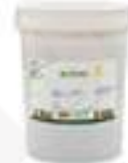
PASTA AVELLANA TORRADA PIAMONT SEVAROME HFC88 1 kg