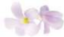
FLOR D'OXALIS CGF18