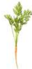
PASTANAGA MICRO CGV02 40-50 unitats