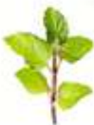
HERBAL TOPS DE MENTA AMB SABOR A PINYA CG069