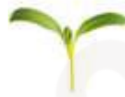
MICROBROTS DE BLEDA CG006 100 g