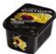
PURÉ DE MARACUJÀ FLAVICARPA 100%