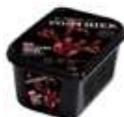
PURÉ DE REMOLATXA