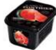
PURÉ DE SÍNDRIA