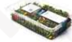
MICRO MESCLUM FLORAL CG052 250 g