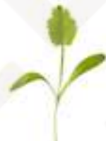
MICROBROTS DE CORIANDRE CG032 / CG016 50 g / 100 g