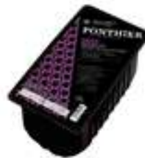
GROSELLA NEGRA FCP005 1 kg