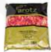
MADUIXETA DE BOSC FAC02 1 kg