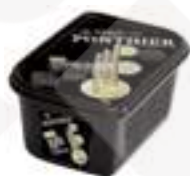
PURÉ D'ESPÀRREC BLANC 100%