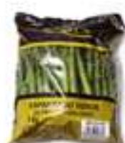
ESPÀRREC VERD AROTZ