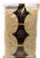
PIPES PELEDES SALADES HFS043 1 kg