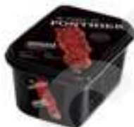
PURÉ DE GROSELLA VERMELLA PFP014 1 kg