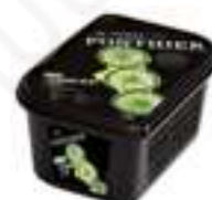
PURÉ DE LLIMA 100% PFP078 1 kg