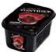
PURÉ DE MAGRANA PFP039 1 kg