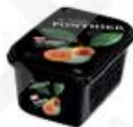
PURÉ DE CALAMANSI 100% PFP047 1 kg