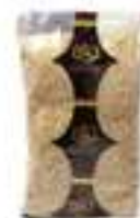
PIPES PELEDES HFS040 1 kg