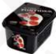
PURÉ DE LITXI 100% PFP064 1 kg