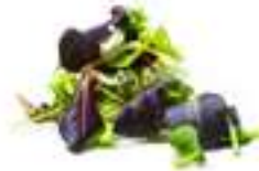
MESCLUM DE SABORS VARIATS

HFV86 1 kg Mesclum elaborat a partir de quatre varietats de productes recollits en el seu punt màxim de frescor i propietats.