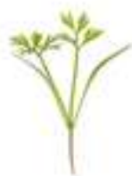
PASTANAGA MORADA BABY CGV15 15-50 unitats