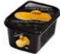
PURÉ DE PRUNA MIRABEL DE LORENA (IGP)