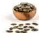
PIPES DE CARBASSA CRUES PELEDES HFS65 500 g