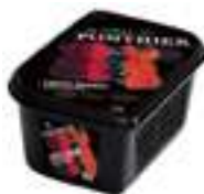
PURÉ DE FRUITS VERMELLS PFP027 1 kg