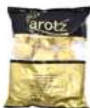
FONS DE CARXOFA AROTZ