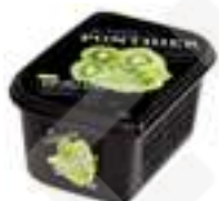
PURÉ DE KIWI (IGP) 100% PFP015 1 kg