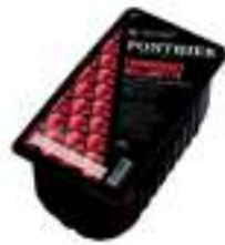
GERS D'IMPORTACIÓ WILLAMETTE FCP009 1 kg