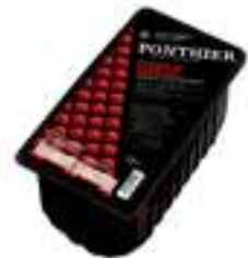
GROSELLA VERMELLA FCP011 1 kg