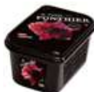
PURÉ DE CIRERA VERMELLA PFP044 1 kg