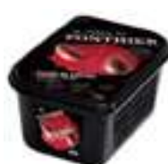
PURÉ DE FIGA DE MORO PFP100 1 kg