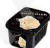
PURÉ DE PERA WILLIAMS