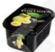
PURÉ DE BERGAMOTA 1005 PFP048 1 kg