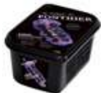
PURÉ DE GROSELLA NEGRA PFP004 1 kg