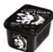
PURÉ DE COCO D'INDONÈSIA PFP083 1 kg