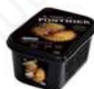
PURÉ DE CASTANYA PFP018 1 kg