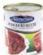
TOMÀQUET SEC AMB OLI