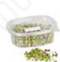
MICROMESCLUM MIX CG051 / CG001 / CG020 50 g / 100 g / 250 g