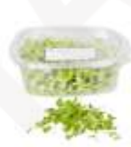
MICROBROTS DE RUCA CG039 / CG015 50 g / 100 g