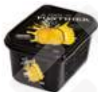
PURÉ DE PINYA