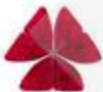
FULLES D'OXALIS CG076