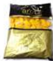
DAUS DE MANGO DOLÇ