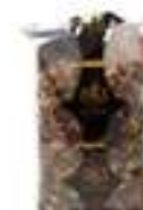
CÒCTEL PER AMANIDES