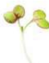
MICROBROTS DE MOSTASSA DIJON CG077 / CG009 50 g / 100 g