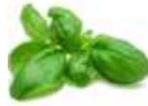
MICROBROTS D'ALFÀBREGA GENOVESA CG083 / CG075 50 g / 100 g