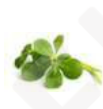
MICROBROTS DE VERDOLAGA CG063 100 g