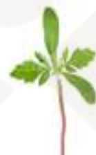
MICROBROTS DE MANDARINA CG045 50 g