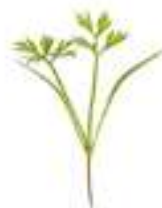
PASTANAGA MORADA MICRO CGV29