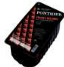
FRUITA DEL BOSC VERMELLA