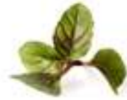
HERBAL TOPS DE MENTA XOCOLATA CGF066