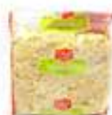
AMETLLA LAMINADA CRUA