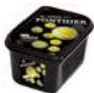
PURÉ DE SUDACHI 100%