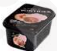
PURÉ DE PRÉSSEC BLANC