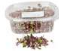
MICROBROTS D'ALFÀBREGA MORADA CG053 / CG004 50 g / 100 g