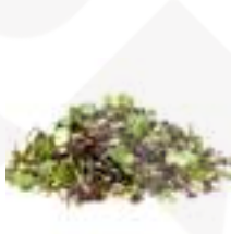
MICROMESCLUM MIX PICANT CG054 100 g