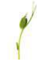
MICROBROTS DE PÈSOL DOLÇ CG011 100 g