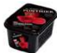
PURÉ DE PEBROT VERMELL 100%