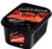
PURÉ DE MARA BOIS PFP035 1 kg