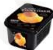
PURÉ D'ALBERCOC PFP001 / PFP051 1 kg / 20 kg