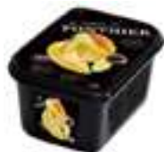
PURÉ DE FRUITES EXÓTIQUES PFP008 1 kg