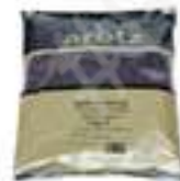
MORES SILVESTRES HFC02 1 kg