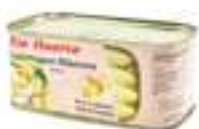
ESPÀRRECS BLANCS EXTRES

CODI CB21 / CB20 FORMAT 6-8 unitats / 8-12 unitats