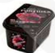
PURÉ DE CIRERA NEGRA 100% PFP032 1 kg