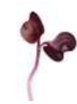
MICROBROTS DE RAVE MORAT CG072 / CG012 50 g / 100 g