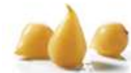
PERA AMB ALMÍVAR