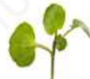
MICROBROTS DE CREIXEN CG007 100 g