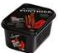
PURÉ DE RUIDABRE 100%