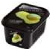
PURÉ DE PRUNA REINA CLAUDIA DE QUERCY