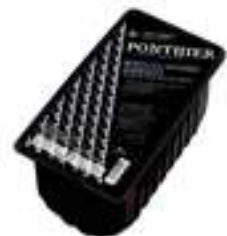
NABIUS SILVESTRES FCP021 / FCP060 1 kg / 10 kg