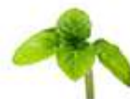
HERBAL TOPS DE MENTA LLIMONERA CG067