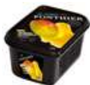
PURÉ DE MANGO 100%