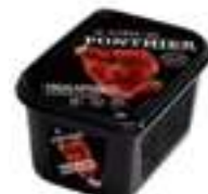
PURÉ DE MADUIXA GARIGUETTE PFP082 1 kg