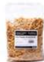
CEBA FREGIDA DESHIDRATADA