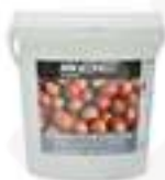
PASTA PURA D'AVELLANA BCC121 1 kg