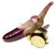
ALBERGÍNIA BABY CGV16