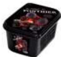
PURÉ DE MORA