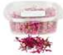
MICROBROTS D'AMARANT CG043 / CG005 50 g / 100 g