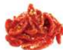
TOMÀQUET SEMI SEC AMB OLI