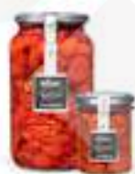
TOMÀQUET CHERRY AMB OLI