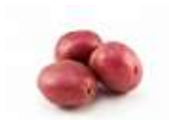
PATATA DEL BUFET VERMELLA