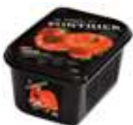
PURÉ DE MADUIXA 100% PFP009 / PFP120 / PFP062 1 kg / 5 kg / 20 kg