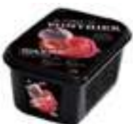
PURÉ DE PRÉSSEC DE VINYA