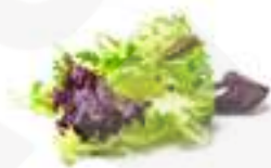
MESCLUM DE QUATRE VARIETATS

HFV86 1 kg Mesclum elaborat a partir de quatre varietats de productes recollits en el seu punt màxim de frescor i propietats.