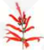
FLOR DE SÀLVIA PINYA CGF29