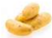
PATATA DEL BUFET HF85