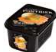
PURÉ DE MELÓ (IGP) 100%