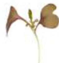
MICROBROTS DE MOSTASSA ARRISSADA CG062 100 g