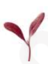
MICROBROTS DE REMOLATXA CG031 / CG024 50 g / 100 g