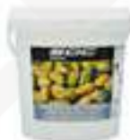
PASTA PURA DE FESTUC BCC122 1 kg