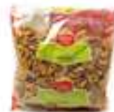
MEITATS DE NOUS EXTRA CLARES HFS42 1 kg