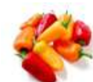
PEBROT BABY COLORS