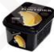
PURÉ DE PLÀTAN