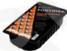
MEITATS D'ALBERCOCS FCP001 1 kg