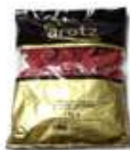
PEBROTS PIQUILLO AROTZ