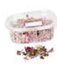
MICROMESCLUM VERMELL CG049 / CG002 50 g / 100 g