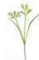
MICROBROTS DE PASTANAGA CG040 / CG050 50 g / 100 g