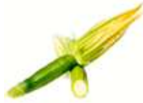
CARBASSÓ AMB FLOR MINI CGV03