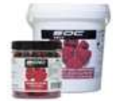
GERD SENCER LIOFILITZAT