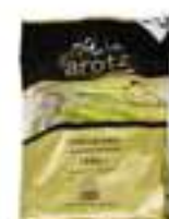
ESPÀRREC VERD AROTZ