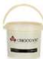
PRALINÉ D'AVELLANA 50% XOC89 5 kg