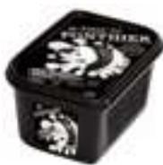
PURÉ DE COCO INTENS PFP007 / PFP116 1 kg / 5 kg