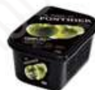
PURÉ DE POMA VERDA GRANNY SMITH