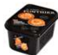
PURÉ DE TARONJA SANGUINA 100%