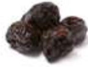
PRUNA SECA AMB PINYOL