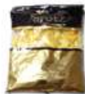
DAUS DE PINYA DOLÇA