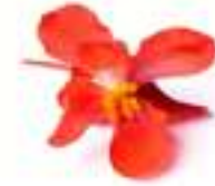
FLOR DE BEGÒNIA VERMELLA CGF03