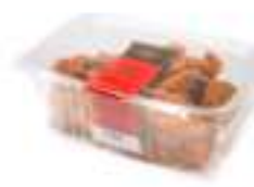
ORELLONS DE PRÉSSEC