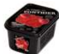
PURÉ DE GERDS WILLAMETTE 100% PFP040 / PFP118 1 kg / 5 kg