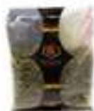
FESTUC VERD REPELAT CRU HFS10 500 g