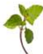
HERBAL TOPS DE MENTA IFRUITES DEL BOSC CG068