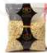
PINYÓ EXTRA HFS83 / HFS12 500 g / 1 kg